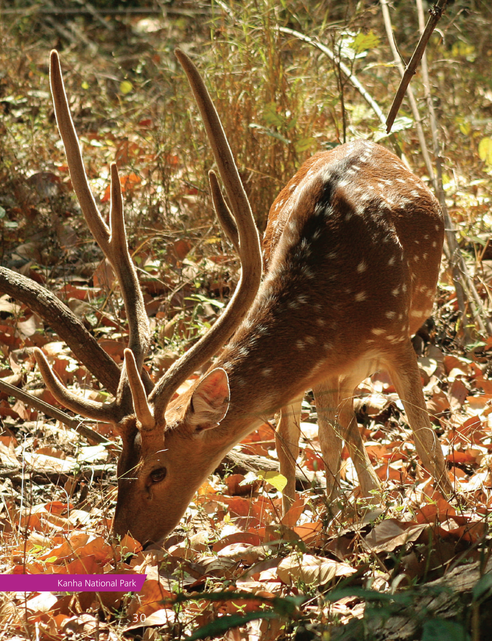
Kanha National Park